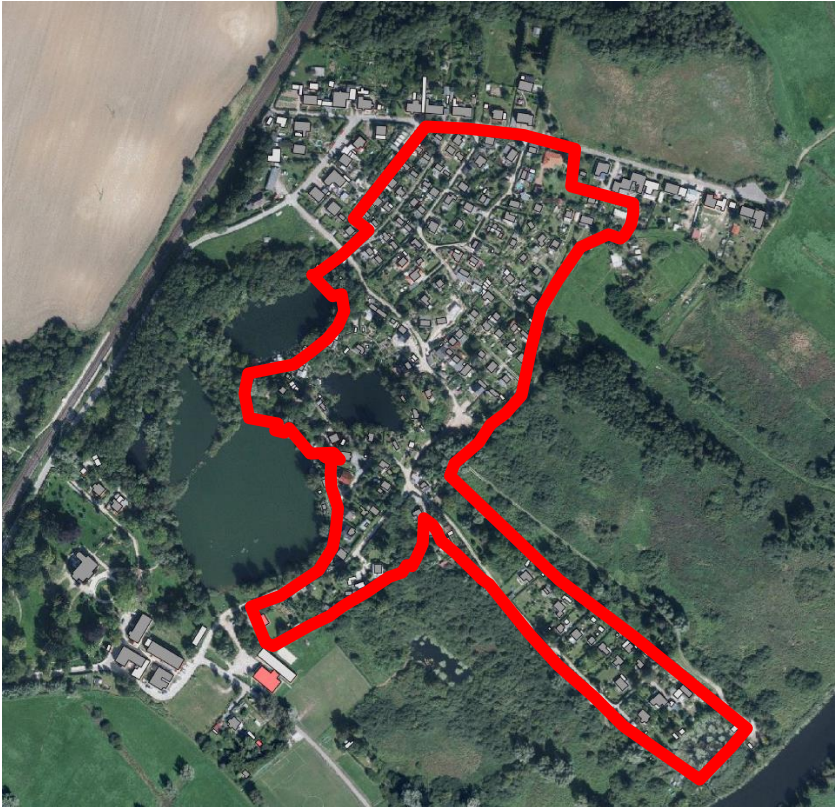
Abb.: Luftbild